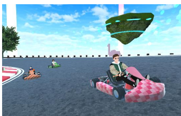
【ハルカス バーチャルサーキット（イメージ）】