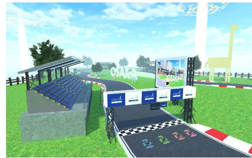
【ハルカス バーチャルサーキット (イメージ)】

そして9月には「レースモード」が公開予定。複数人でのレースが楽しめるようになります。今回の「タイムアタックモード」で練習をしながら、「レースモード」に向けて腕を磨くのもおすすめです。