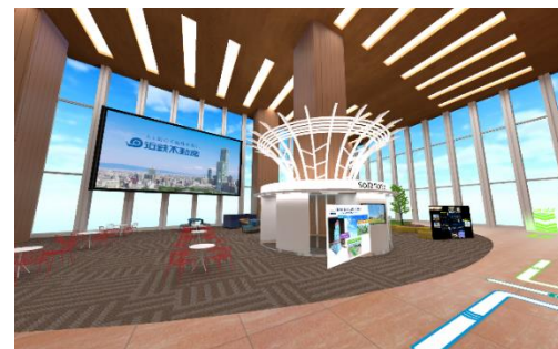
【17階ミドルフロア「soranosu」 (イメージ)】