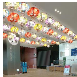
【ランタン装飾 イメージ】

【展示場所】 2階 ウエルカムギャラリー（約60基） 16階 ロビー（約150基+巨大ランタン1基）