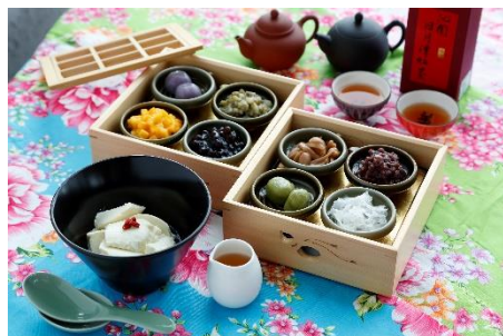
【台湾スイーツ「豆花」】