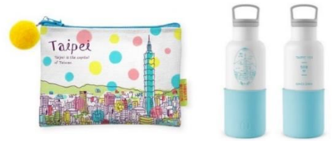
【台北101賞 グッズ イメージ】