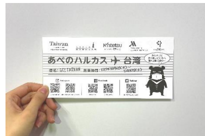
【クイズラリー用紙 イメージ】