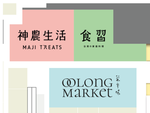
【あべのハルカス近鉄本店 10階 フロアマップ】

台湾の家庭料理が楽しめるレストラン「食習」や、日本最大級の品数を取り揃えた台湾茶のセレクトショップ「Oolong Market 茶市場」も同時にオープンし、台湾を存分に楽しめる3つのゾーンが誕生しました。コロナ禍で海外旅行に行けない今、台湾の食、雑貨などのライフスタイルに触れることで、台湾旅行気分を手軽に楽しめます。