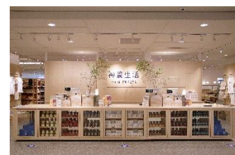
【神農生活 イメージ】

【販売日時】 10月 9日（土）、10日（日）、 16日（土）、17日（日）、 23日（土）、24日（日）、30日（土） 各日11:00～17:00