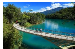
【写真展 イメージ画像】