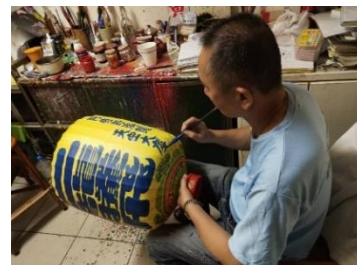
【手描きオリジナルランタン 制作風景】