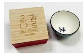
【台湾観光賞 おちょこ】