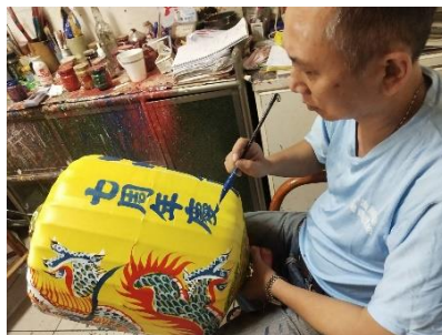
【手描きのオリジナルランタン】