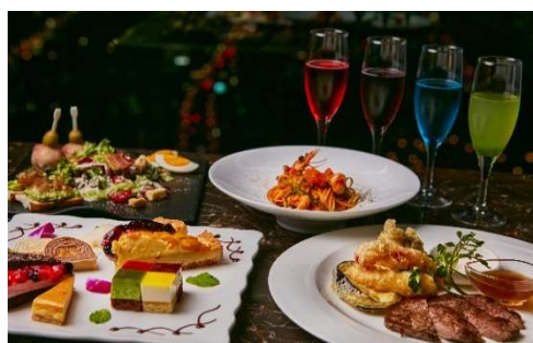
【女子会プラン料理イメージ】