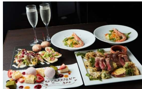
【ペアプラン料理イメージ】