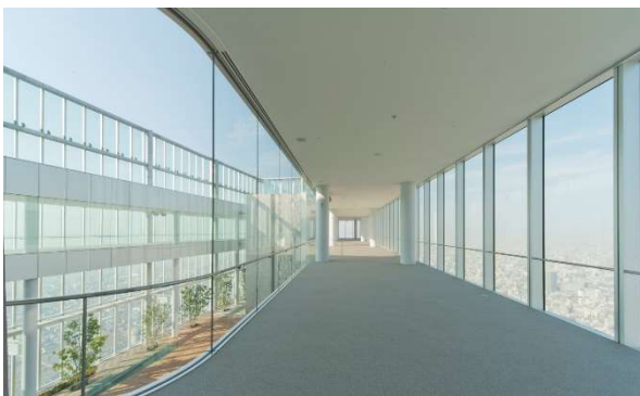
【屋内で快適鑑賞プランエリア】 ※窓側にパイプ椅子を3列、後ろに立見席を設置