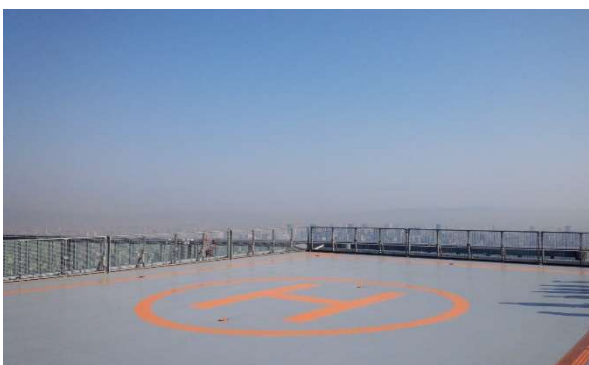
【最頂部で鑑賞する贅沢プランエリア】 ※ハルカスの最頂部から立見でのご鑑賞