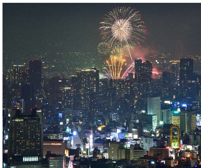
「ハルカス300（展望台）」から見る「なにわ淀川花火大会」（過去開催の様子）