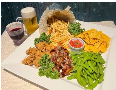
【グループわいわいプラン料理イメージ】