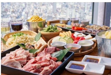
【BBQプラン料理イメージ】