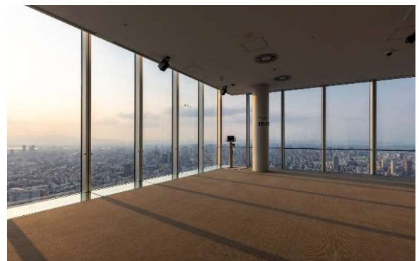
【屋内でグループ鑑賞プランエリア】 ※窓ガラス1枚ごとに鑑賞エリアを設置（立見席）