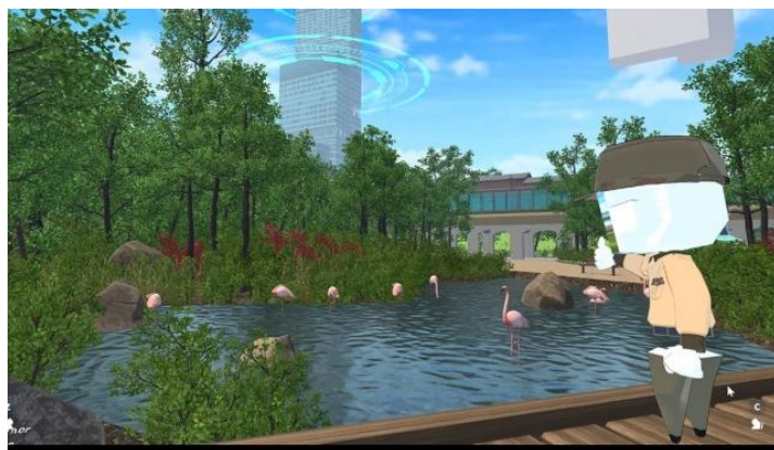
現役飼育員による「バーチャル天王寺動物園ツアー」のイメージ