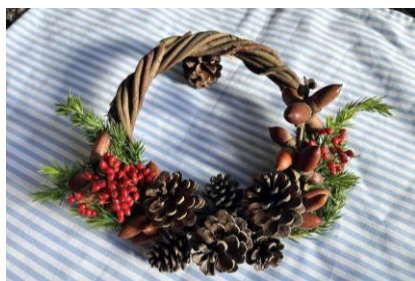
【リースワークショップ】 (富士濃造園)