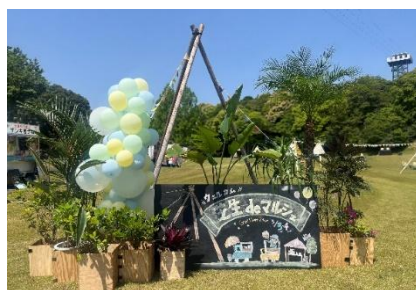
【前回開催時の様子】 (2025年5月3日・4日)