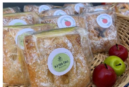
【パイ菓子販売】 (Bambino herb cafe)