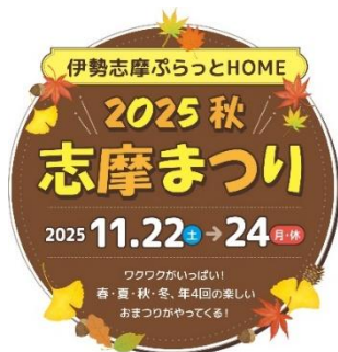
【志摩まつりキービジュアル】