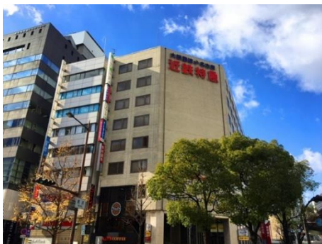
【店舗開設ビル 外観】