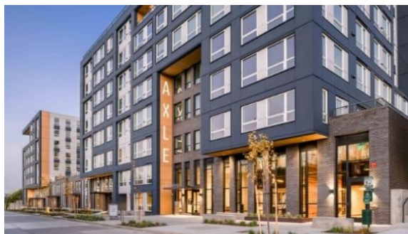
【ワシントン州賃貸住宅】

※バリューアド型ファンドとは、商品の主要な期待リターン源泉が、不動産賃貸からのインカムの獲得に加えて、割安に取得した不動産等について積極的に収益性を高め、不動産価値を増加させることによるキャピタル・リターンの獲得を目的として運用される商品。