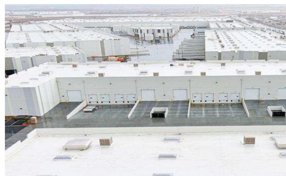
【ネバダ州物流施設】