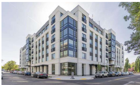
【オレゴン州賃貸住宅】