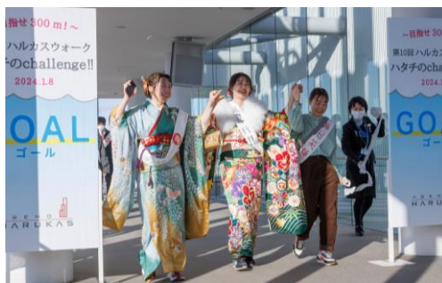
【ゴールの様子】 (第10回ハルカスウォーク)