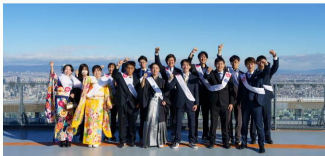
【ヘリポート記念撮影の様子】 (第10回ハルカスウォーク)