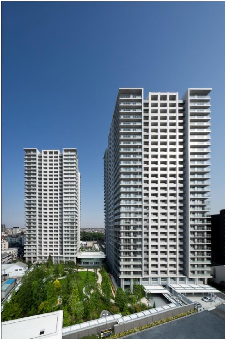
フォレストタワー