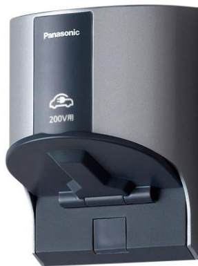
カーコンセントイメージ写真