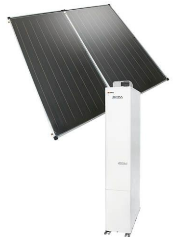
パネル&貯湯ユニットイメージ写真