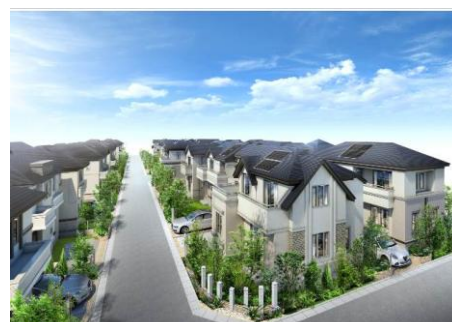
(仮称)三鷹市大沢三丁目計画のイメージイラスト