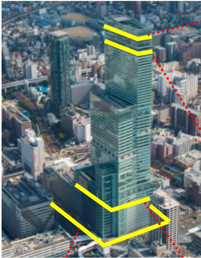
トゥインクルライト