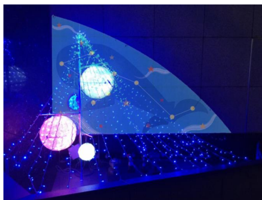
アポロ・ルシアスビル