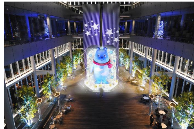
ハルカス300(展望台) 58階天空庭園