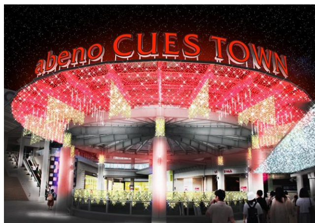
あべのキューズタウン