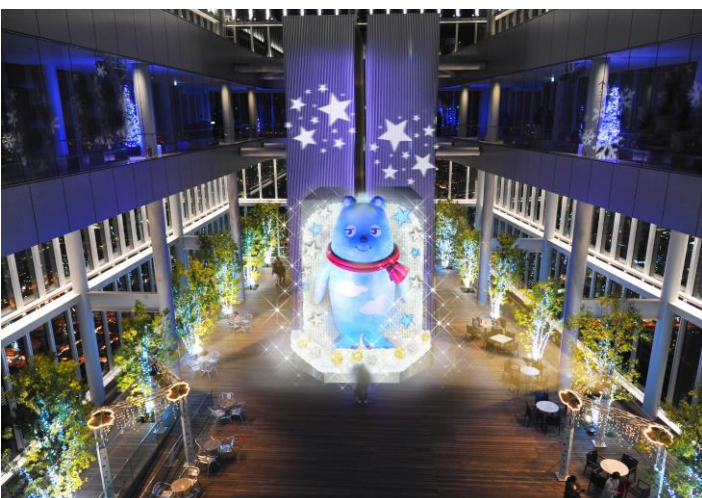
58階天空庭園（イメージ）

まばゆい光に包まれたあべのハルカスをはじめとした、あべの・天王寺でイルミネーションをお楽しみください。詳細は別紙のとおりです。