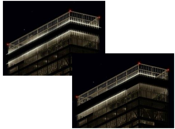
駆け巡るイルミネーション