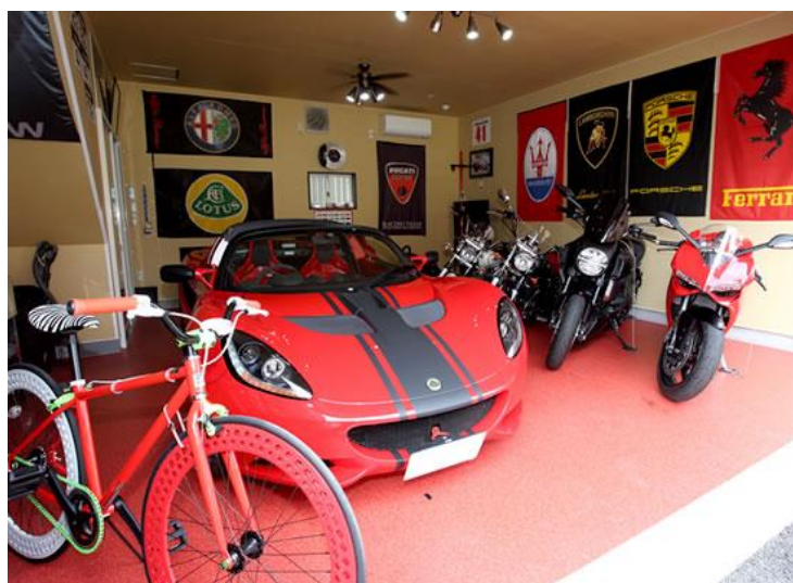
【ガレージハウス利用イメージ】