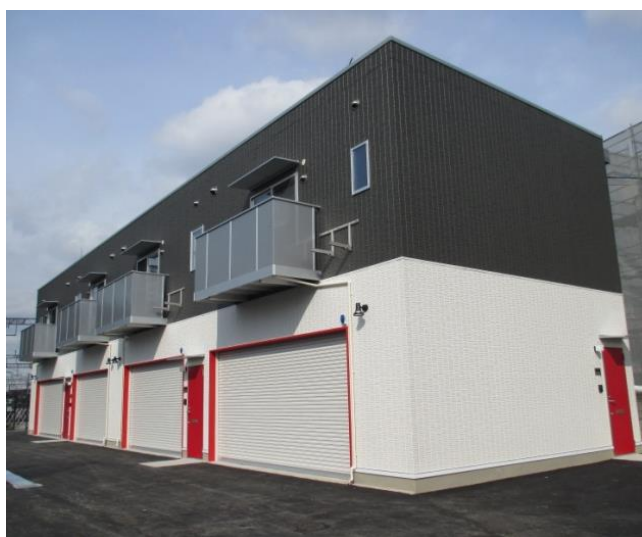
【ガレージハウス外観イメージ】