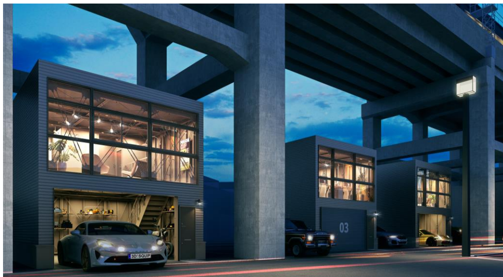
【K・BLOC ABENO-TENNOJICHO 外観イメージ】