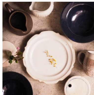
アベノのお店 カタルテ