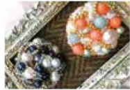
天王寺のお店 1 アトリエ seeds [ニット小物、つまみ細工、ビーズアクセサリー]

地元ゆかりの商品、阿倍野・天王寺のお店、ハンドメイド、クラフトなどを販売するお店が20店舗以上出店！ 店主さんたちの思いがたくさん詰まった手づくり作品がいっぱい！