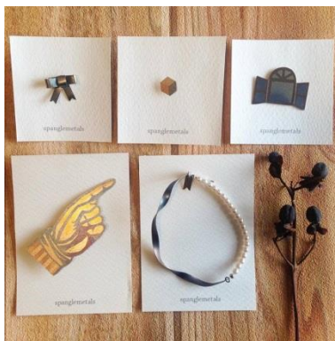
天王寺のお店 きになる舎