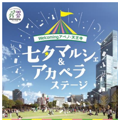
七タマルシェ&アカペラストージ キービジュアル