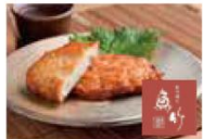
阿倍野のお店 6 魚竹蒲鉾店 [創作練天]