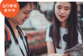
※詳しくは受付会場にて

地図をもとに、神社、寺院、動物園など、アベノ・天王寺の様々な場所を制限時間内に回り、得点を集めるスポーツです。