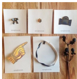
天王寺のお店 きになる舎