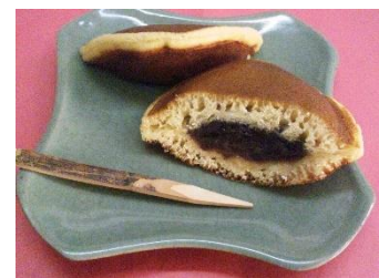
阿倍野のお店 御菓子司亀屋茂廣