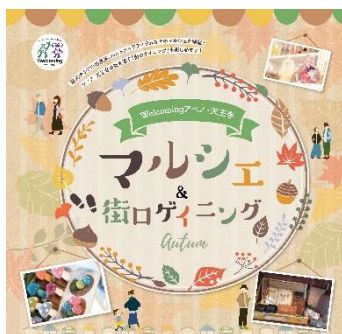
マルシェ&街ロゲイニング キービジュアル