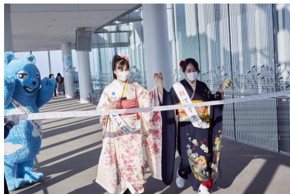
【前回のゴールの様子】