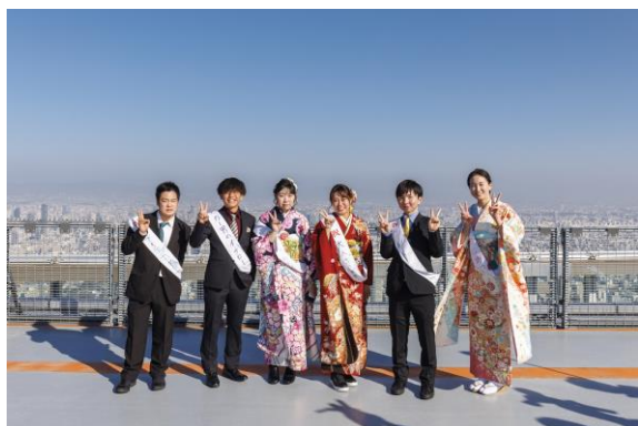
【前回のヘリポート記念撮影の様子】

「あべのハルカス」が参加者にとって一生の思い出の場所となるよう、ハタチを迎える皆さまのご参加をお待ちしています。イベントの詳細、申込方法などは別紙をご覧ください。