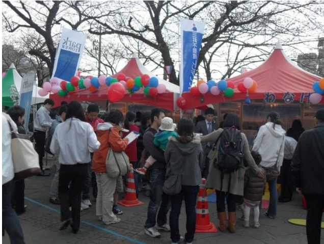
「北区さくら SA*KASO 祭り」

毎年、春先に飛鳥山公園で行われる「北区さくら SA*KASO 祭り」や、東十条商店街で行われる、「東十条商店街 春まつり」などの様々な地元イベントに「ザ・ガーデンズ東京王子」や「Discover OJI」のブース出展を行い、地元住民を始めとした多くの人たちに楽しんで頂けるイベントなどを予定しております。