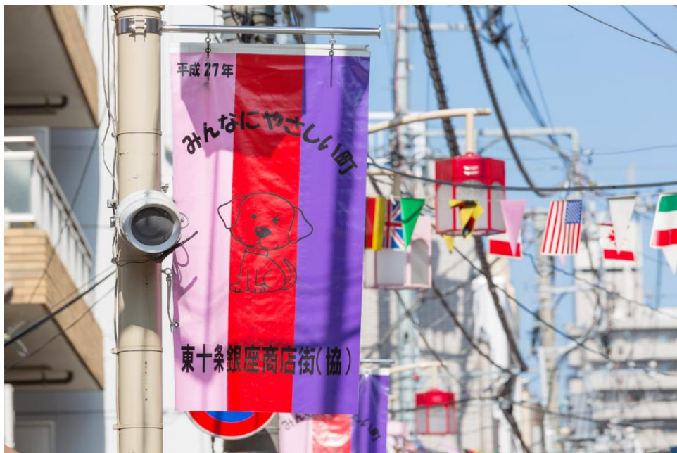
「東十条銀座商店街 フラッグの一例」

東十条商店街・東十条銀座商店街にある約80本のフラッグに、地元商店街と「ザ・ガーデンズ東京王子」がコラボしたフラッグを掲出し、新たに誕生する大型集合住宅が完成することによる、地元商店街のさらなる発展と、地元の盛り上がりをアピールします。