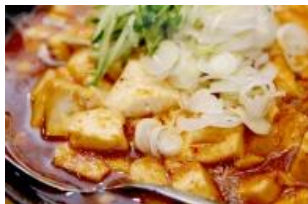
「とん八（からし焼き）」