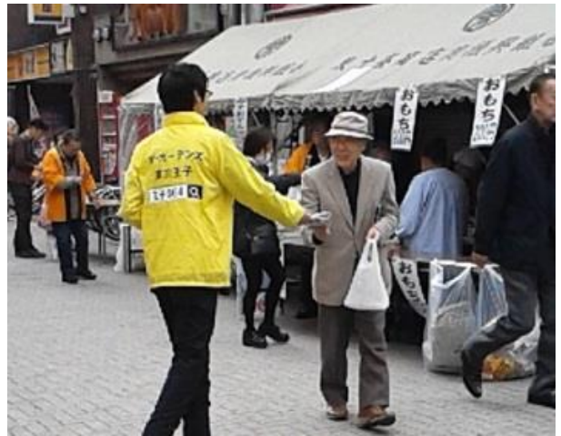
「東十条商店街 春まつり」

東十条商店街・東十条銀座商店街にある約80本のフラッグに、地元商店街と「ザ・ガーデンズ東京王子」がコラボしたフラッグを掲出し、新たに誕生する大型集合住宅が完成することによる、地元商店街のさらなる発展と、地元の盛り上がりをアピールします。