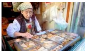
「平澤かまぼこ 王子駅前店」