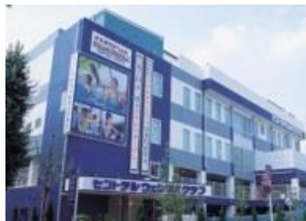
「セントラルウェルネスクラブ東十条」