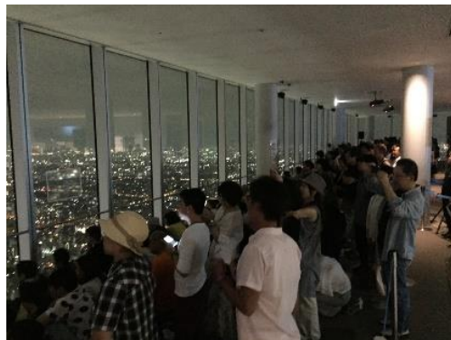
「特別観覧エリア」の様子（2018年）