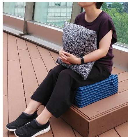
「ぶるぶる楽（たの）シート」 イメージ写真