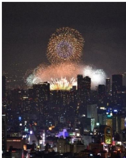
「ハルカス300」から見る 「なにわ淀川花火大会」