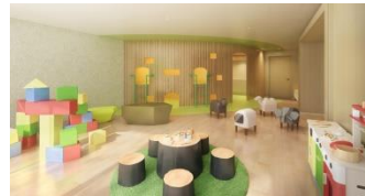
【キッズルーム完成予想CG】