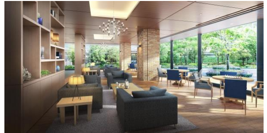
【カフェラウンジ完成予想CG】