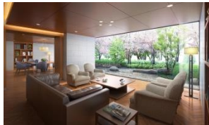
【サクラサロン完成予想CG】