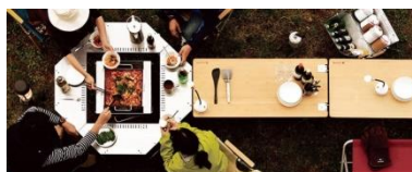
火を囲める”ジカロテーブル”参考写真