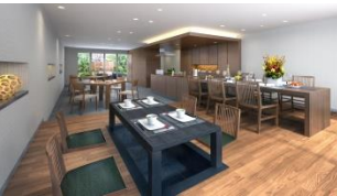
【パーティーラウンジ完成予想CG】