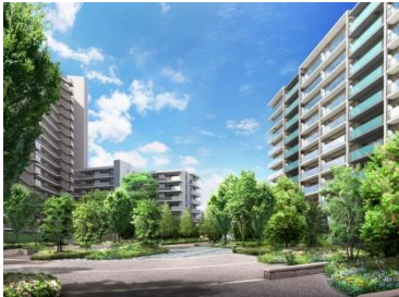
【プラザガーデン完成予想CG】