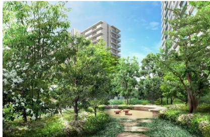
【シーズズガーデン完成予想CG】