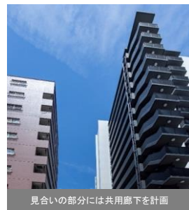
【周辺建物への配慮と「2つの顔」をもつ外観デザイン】