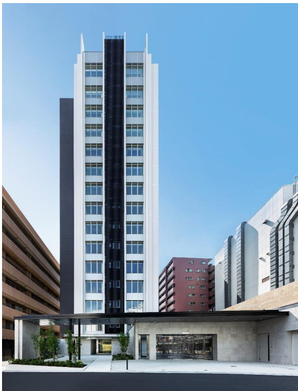
【ローレルアイあべの 外観】

これからも、「人と街の可能性を拓く。」というコーポレートステートメントのもと、総合デベロッパーとして、「ローレルマンションシリーズ」をはじめ、今後も多くのお客さまに愛される、快適で豊かな住まいや街づくりに努めてまいります。