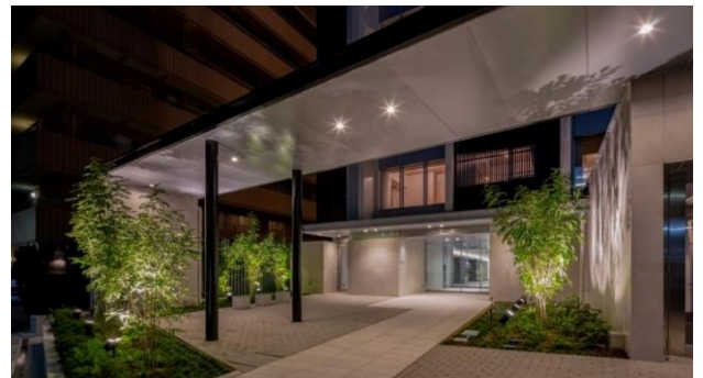
【エントランスアプローチ】