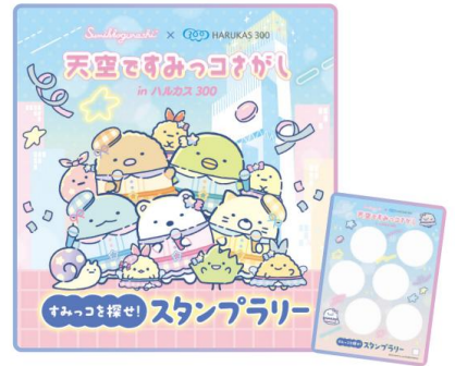
【すみっコを探せ！スタンプラリー】

展望台内各所を巡って6種類のスタンプを集めていただくスタンプラリーをお楽しみいただけます。 また、すべてのスタンプを集めた方には、「イベントオリジナルステッカー」を16階コラボグッズ販売コーナーにて、プレゼントします。 ※限定品のため無くなり次第終了します。