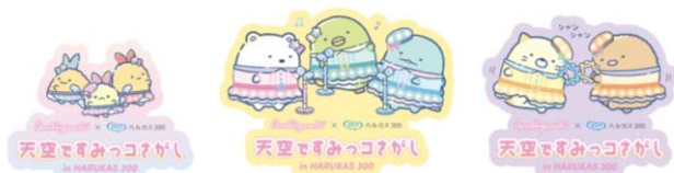
【ランダムステッカー】