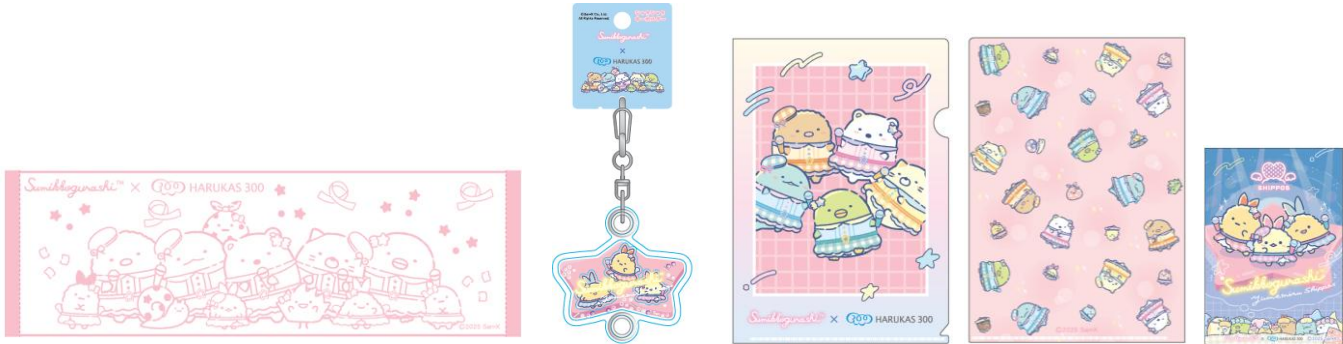
【限定コラボグッズ例】