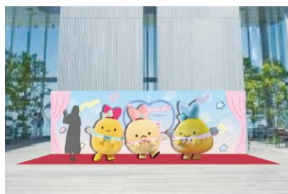
【しっぽず 1Dayスペシャルステージ】