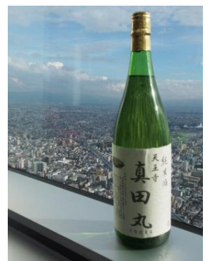
天王寺区限定日本酒「真田丸」