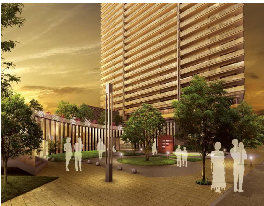
外観イメージイラスト(公開空地)

※各イメージイラストは設計図書をもとに描いたもので、 形状・仕上・植栽・色彩等は異なります。