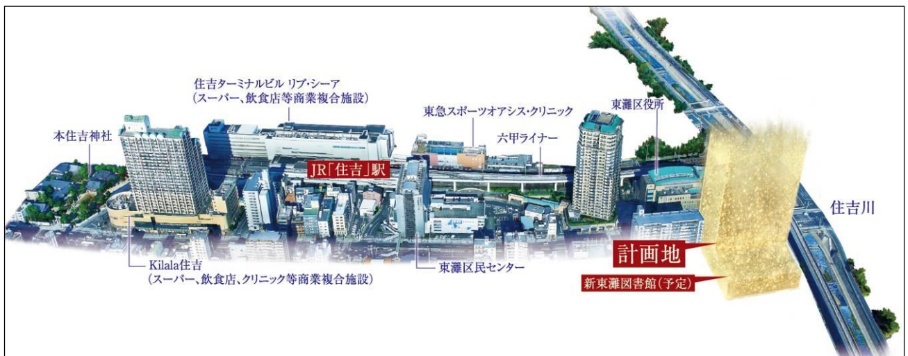
「旧東灘区役所跡地再開発プロジェクト」計画予定地全体パース

分譲マンション(レジデンス棟)は野村不動産、近鉄不動産、長谷工コーポレーションの開発となります。