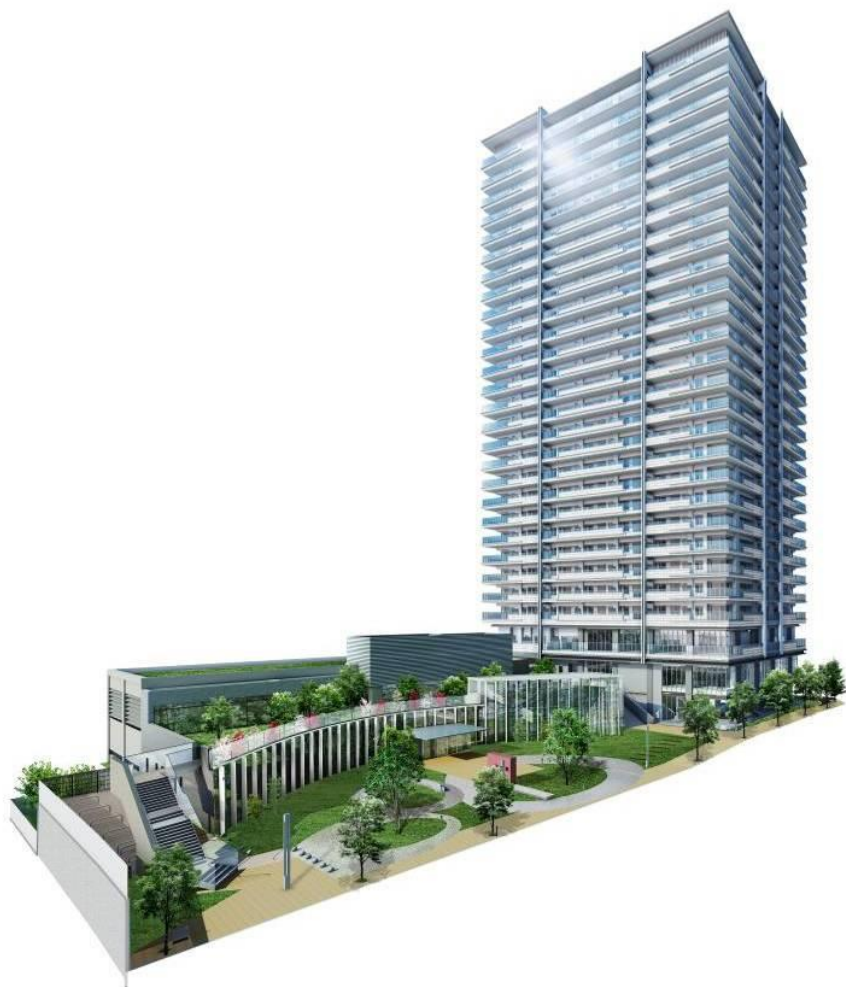
外観イメージイラスト(全景) (左)低層棟:文化施設棟(図書館・だんじり資料コーナー) (右)高層棟:分譲マンション(レジデンス棟・カフェ)