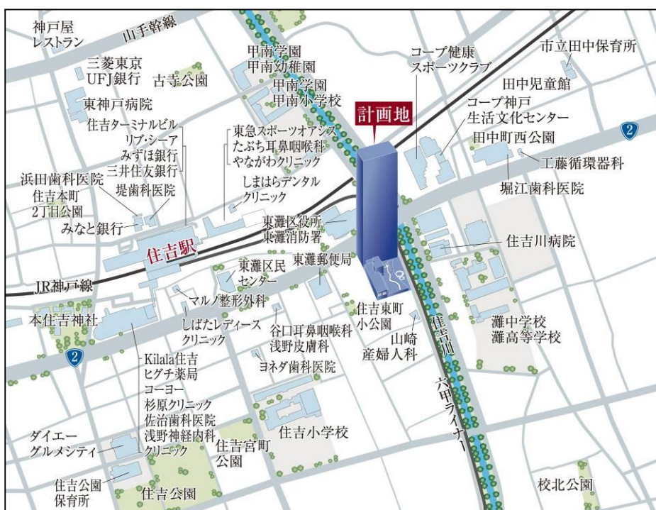
「旧東灘区役所跡地再開発プロジェクト」周辺地図