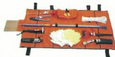
簡易レスキューセット