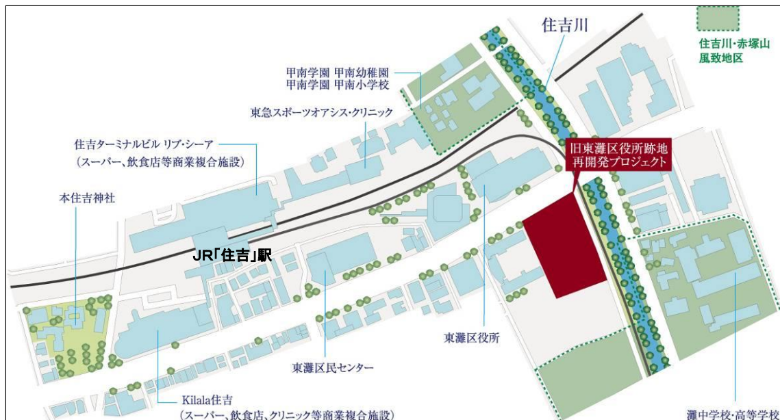
「旧東灘区役所跡地再開発プロジェクト」計画予定地と周辺街区

本プロジェクトの計画地は、この住吉川河畔に広がる風致地区と、JR住吉駅からつづく東灘区の中核地区とが交差する地点に位置し、住吉ならではの豊かな環境と都市としての利便性を兼ね備えた地域です。