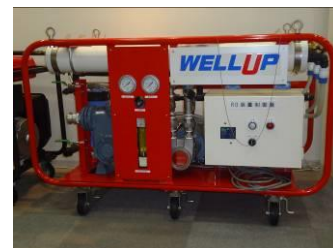
非常用飲料水生成システム「WELL UP」