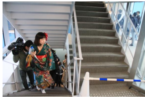
【階段を上る参加者】