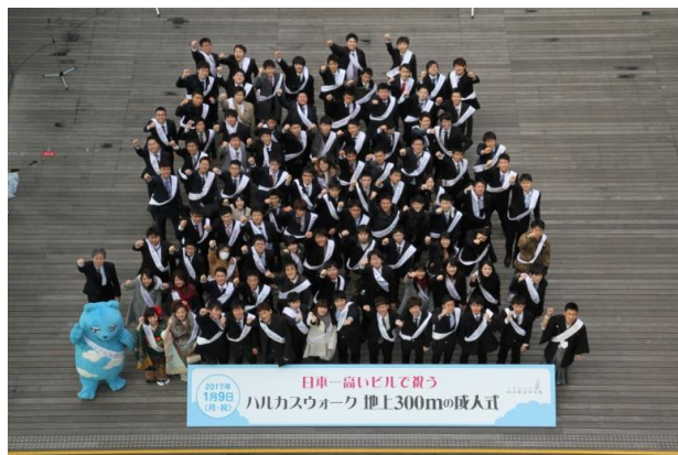
参加者の記念撮影の様子 （第4回ハルカスウォーク）