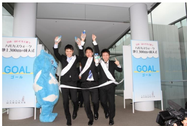
ゴールする新成人 （第4回ハルカスウォーク）

今後も「あべのハルカス」では皆様のご期待に沿うようなイベントを展開していきます。