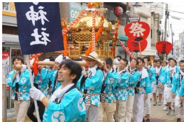
「2017年度秋祭りの様子」

何度も災難を払って甦るこの「阿倍野神輿」にあやかって、皆様も厄除け、運氣上昇のご利益をいただいで下さい。