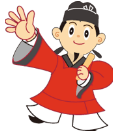
まなりくん(藤井寺市)