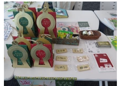
【販売する古墳グッズ】