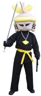
ハニワこうてい (しおんじやま古墳)