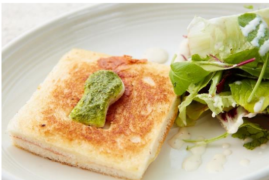
古墳クロック・ムッシュ