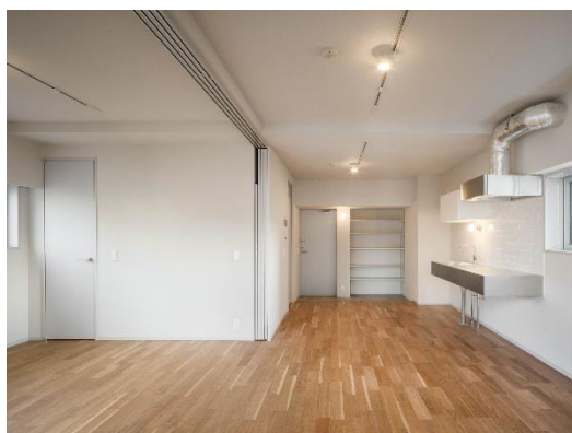
【Cタイプ (室内・フローリング)】