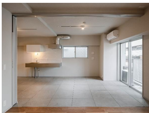
【Cタイプ (室内・タイル)】