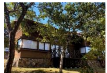
都リゾート 奥志摩 アクアフォレスト コテージ

「近鉄・伊勢志摩ワーケーション」は、三重県志摩市の「都リゾート 奥志摩 アクアフォレスト」の自然豊かな独立コテージ棟をベースに、ホテル本館には共用スペースを用意し、専用通信回線を整備するなどの環境を整え、複数の企業様のご協力を得ながら、オフィス（働く）と住まい（暮らす）と観光（遊ぶ）を融合した新たな働き方の創出を目指しています。2020年11月開始から、20社、約400人の方にご利用いただいています。