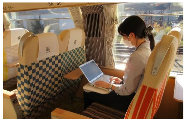
車内でのリモートワーク（イメージ）