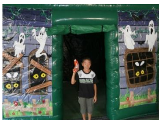
お化けシューティング

【設置内容】 ①お化けシューティング（ランダムに映るお化け達をレーザーガンで撃退するゲーム） ②プレゼントボックス（ボックス内で飛んだり跳ねたり自由に遊べる空間）