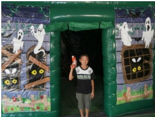
お化けシューティング