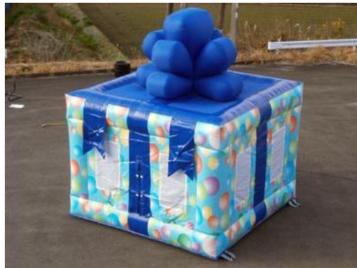
プレゼントボックス