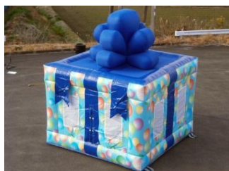
プレゼントボックス

【参加方法】 58階にてチケット綴り「サマーチケット」（500円税込）をご購入いただき、チケット1枚でお好きなアトラクションを1回お楽しみいただけます。 サマーチケット綴り内容：エアートラクション体験利用券（2枚） 子供ビアガーデンメニュー引換券（エアートラクション利用可）