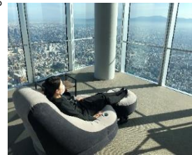
【「快適ソファでおせちプラン」 観賞ソファ】