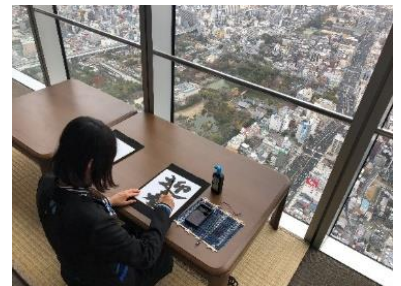
【書初め体験イメージ】

実施日：2022年1月1日（土・祝）～2022年1月3日（月） 実施時間：1月1日（土・祝） 7時30分頃～13時00分 1月2日（日）、3日（月） 11時00分～16時00分 実施場所：ハルカス300（展望台）60階「天上回廊」