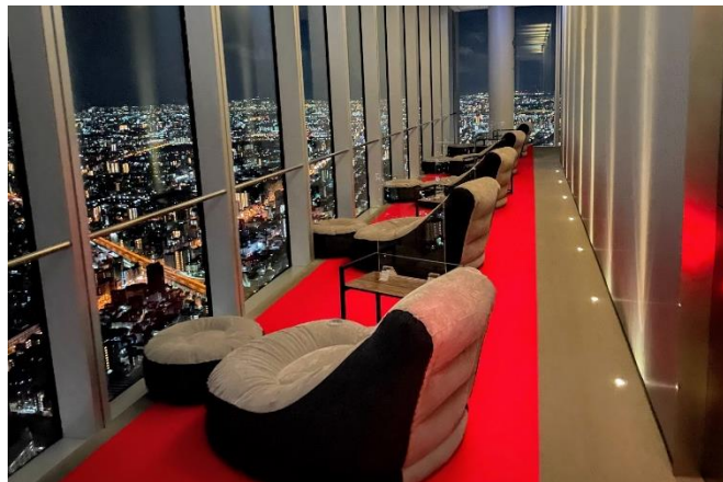
【「快適ソファでおせちプラン」観賞ソファ】