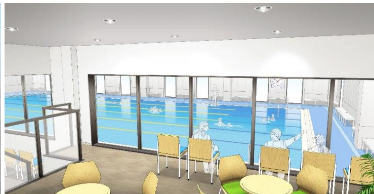
【店舗内イメージ（観覧席）】