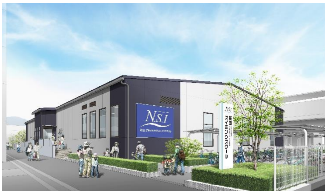
【店舗外観イメージ】

株式会社エヌ・エス・アイは現在、大阪府下で9店舗、西日本を中心に44店舗（指導受託・指定管理含む）を運営しており、「礼儀・感謝・挑戦」の理念の基、「笑顔・心の豊かさ」に日々磨きをかけ安全と安心を最優先に社会から信頼される企業を目指し、これまで以上に地域の皆様に一層愛される店舗を目指します。