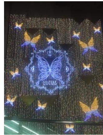
アポロビル・ルシアスビル