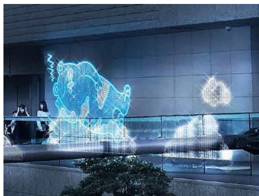
【2階外周デッキあべのべあイルミネーション（イメージ）】