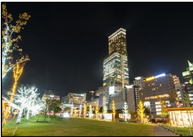
てんしばのイルミネーション（2017年開催時）

2018年3月29日（リニューアルオープンから約2年6か月）には総来園者が1,000万人を突破しました。その後も年間400万人を超えるペースでたくさんの方にご来園いただいております。地域の皆様だけでなく、関西圏広域の方々にお楽しみいただいております。今後も当社は「てんしば」が皆様に親しまれ、愛される場所になるよう、努めてまいります。