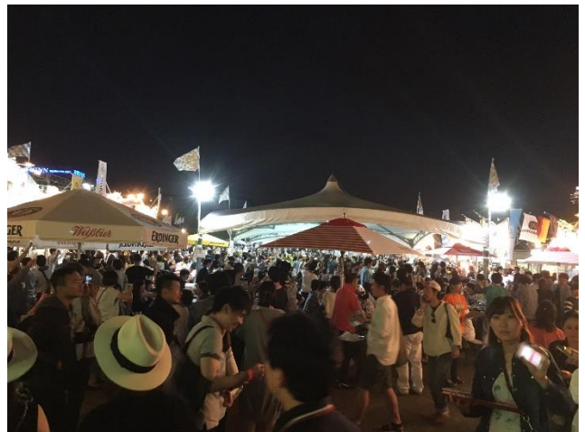
オクトーバーフェストの様子（2016年開催時）