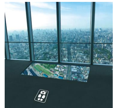
フォトスポットイメージ