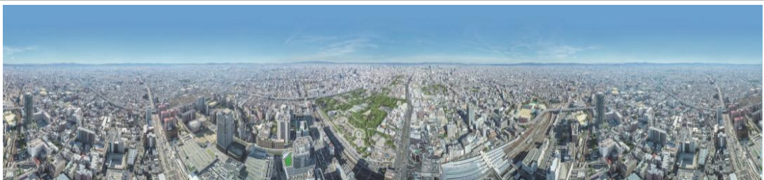
ハルカス300からの眺望