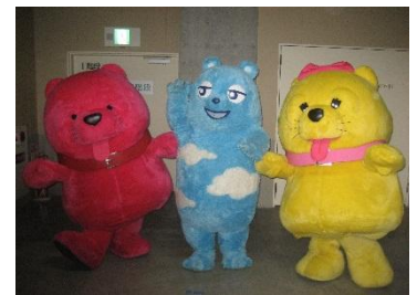
アベーノアベーノ、あべのべあ、ハレコ (画像左から)