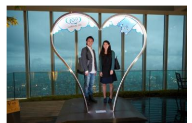
恋人の聖地モニュメント 「Harukas Heart」