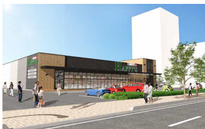
【天満屋ハピーズ昭和町店】

周辺施設には、「イオンモール岡山」(徒歩5分)や「奉還町商店街」(徒歩10分)などがあり、生活利便性が高い立地にあります。また、「厳井東公園」(隣接)や「岡山市立石井幼稚園」(徒歩6分)や「岡山市立石井小学校」(徒歩7分)、「済生会病院」(徒歩17分)など医療・教育施設、公園なども充実しています。