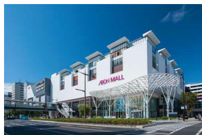
【イオンモール岡山】