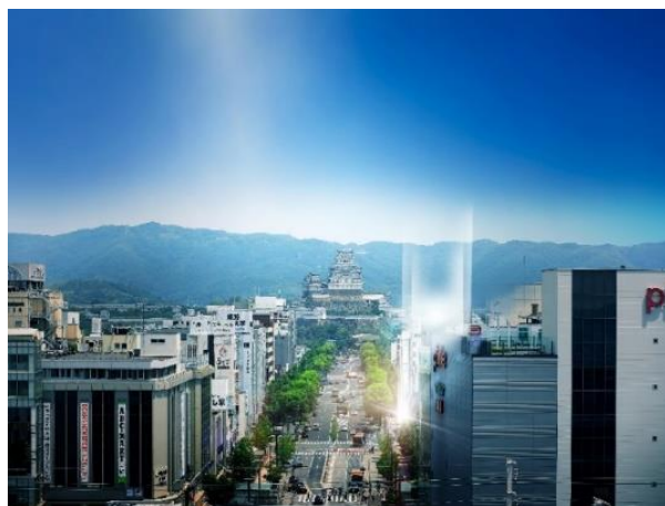
【姫路・大手前通り】