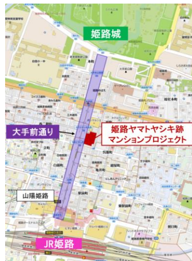
【計画地周辺概念図】

本計画地は「みゆき通り商店街」及び「二階町商店街」に接し、雨の日や暑い日でも快適に姫路駅へアクセスできるほか、「山陽百貨店」や「ピエラ姫路」といった駅前商業施設が近くに位置しています。また、小中一貫教育モデルである「市立白鷺小・中学校」が徒歩圏内であり、豊かな生活利便を享受できる住環境が整っています。