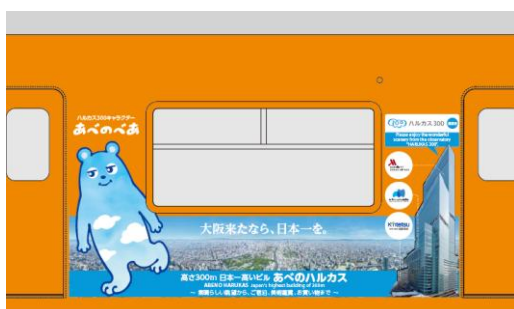
③ あべのべあ + 展望台（昼景）+ビル全景 +各施設ロゴマーク イメージ