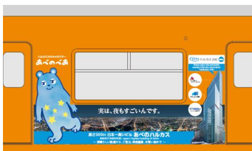
① あべのべあ + 展望台（夜景）+ビル全景 +各施設ロゴマーク イメージ