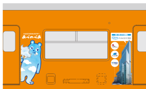
② あべのべあ +ビル全景 +各施設ロゴマーク イメージ