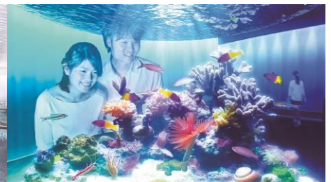
いろにふれる(イメージ)