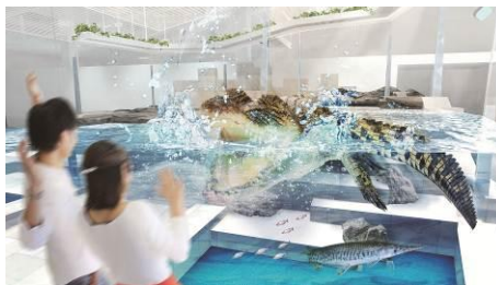
みずべにふれる(イメージ)

コンセプトは、「感性にふれる」。多様ないのちと個性のつながりをテーマに、「いろ」「わざ」「すがた」「WONDER MOMENTS」「みずべ」「うごき」「つながり」の7つのゾーンとそれぞれのインスタレーション(照明、音楽、映像が融合する体験型の展示手法)で、子どもはもちろん大人の感性も刺激します。水族館、動物園、美術館のジャンルを超えた「生きているミュージアム」として万博記念公園に誕生します。