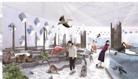
うごきにふれる(イメージ)