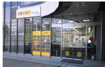
近鉄の仲介 白庭台営業所(奈良県生駒市)