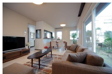
【リノベーション後室内写真】