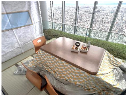
【半個室掘りこたつ】