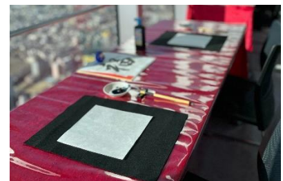
【書初め体験イメージ】