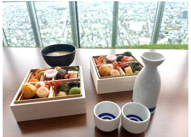
【「こたつ満喫プラン」おせち料理】