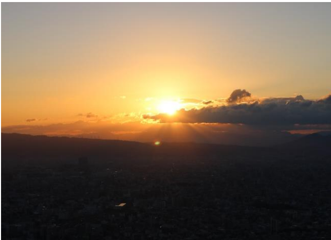
【ハルカス300（展望台）からの初日の出の様子】