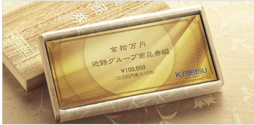
近鉄グループ商品券 7万円