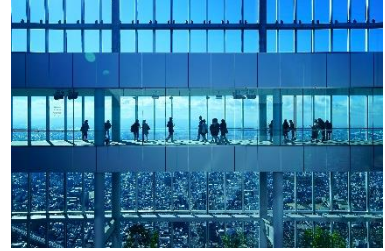
ハルカス300(展望台)ペアチケット