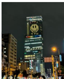
【7周年ライトアップ“Light of Rainbow”】