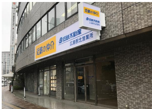
【広島駅北営業所 外観】

名称：近鉄の仲介 広島駅北営業所 所在地：広島県広島市東区若草町9番7号 （三共若草ビル1階） 交通：JR広島駅（新幹線口）徒歩6分 営業開始日：2019年8月3日（土） 営業時間：9：30～18：20 定休日：水曜日および木曜日 問合せ：TEL：082-567-2121 FAX：082-567-6000 7-11：0120-901-152 E-mail：e-ekikita@kintetsu-re.co.jp