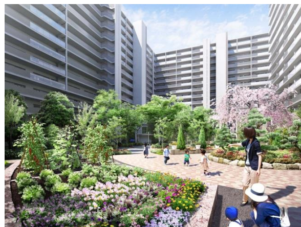
コミュニティガーデン