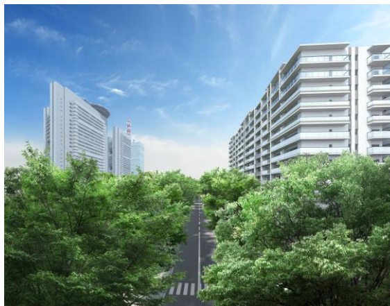
並木道からの建物外観イメージ