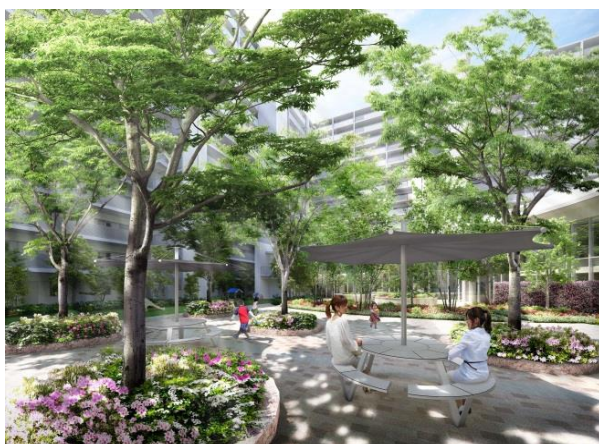
センターフォレスト