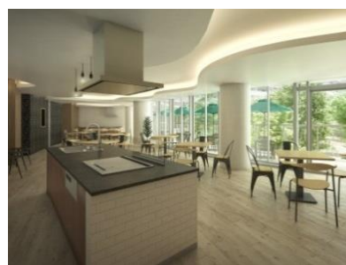
パーティールーム (1・2)