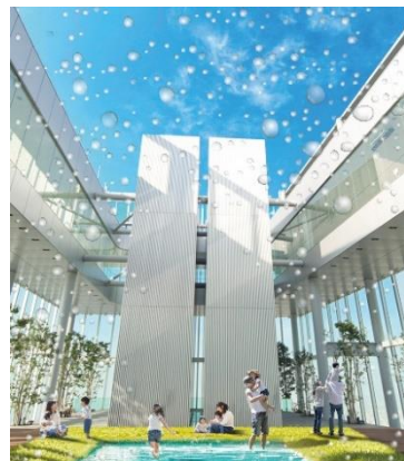
58階天空庭園（イメージ）