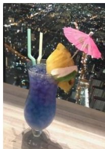
ディープブルーハワイ (税込み680円)