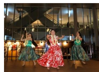
フラダンスショー