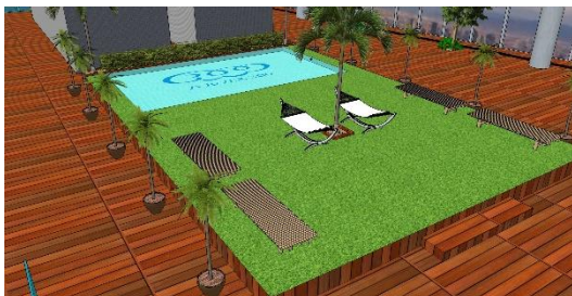
58階天空庭園パース

暑い夏は、都会の避暑地「あべのハルカス」で、体・味・音で「涼」を感じ、お楽しみ下さい。