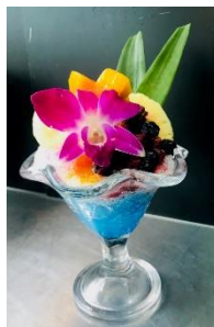
トロピカルフルーツのシェイプアイス (税込み880円)