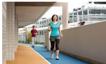
【ウォーキングコース】

「健康」の維持・増進につながるウォーキングコース・エクササイズルーム・マルチスタジオ等の共用施設を整備しています。トレーニング講座やウォーキング講座等の年間プログラムを用意することで、施設利用をサポートすると同時にコミュニティの形成を促し、住民同士をつなげる仕掛けを設定しています。敷地周囲には、地域住民も利用できるランニングコース(歩行空間)と健康イベントの広場ともなる自主管理公園を設けました。