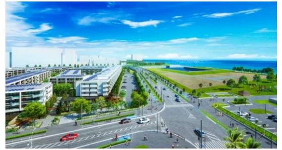
【新浦安マリンヴィラ 南西側完成予想CG】

「ザ・パークハウス 新浦安マリンヴィラ」は平均専有面積96㎡・全145タイプと豊富なプランを揃え、テレワークから趣味の時間まで多様なライフスタイルに合った「新しい暮らし方」を提案します。