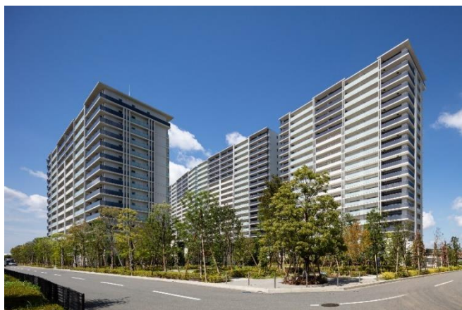
【ローレルスクエア健都ザ・レジデンス】