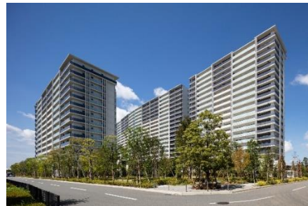
【ローレルスクエア健都ザ・レジデンス 外観】

「ローレルスクエア健都ザ・レジデンス」は、北大阪健康医療都市(通称:「健都」)内に建設された、総戸数824戸の大規模集合住宅です。「健康」をテーマにした共用施設計画・外構計画・ソフトサービスによって健やかな暮らしが実現できる集合住宅を目指しました。