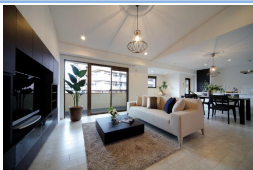
【リノベーション後室内写真(リビングダイニング)】