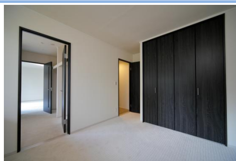
【リノベーション後室内写真(洋室・ウォークスルークローゼット)】