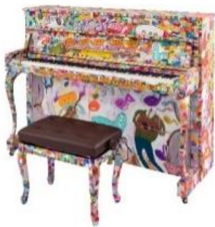
ヤマハのアップライトピアノ “LovePiano” 4号機

ぜひ、「あべのハルカス」で“LovePiano”に触れたり、演奏に耳を傾けたり、音楽による交流をお楽しみください。