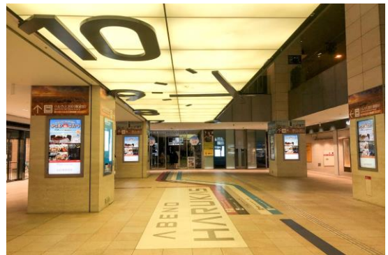
地下1階「時計の広場」