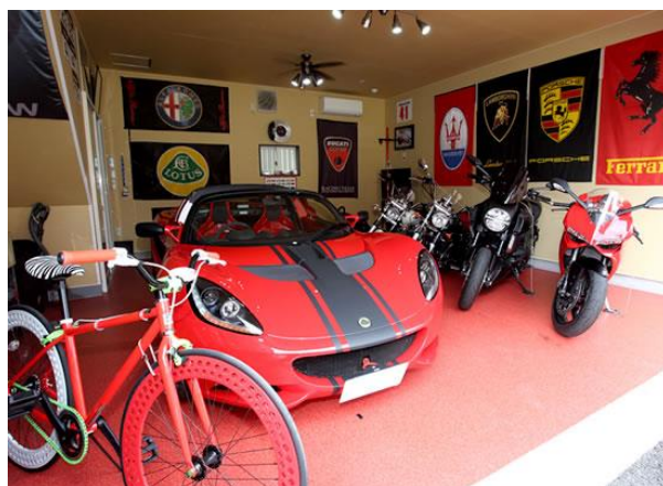
【ガレージハウス利用イメージ】