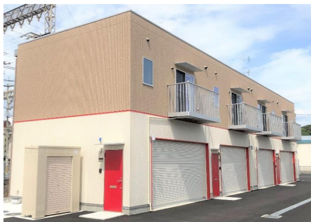
【近鉄☆プレミアムガレージハウス藤井寺 外観】