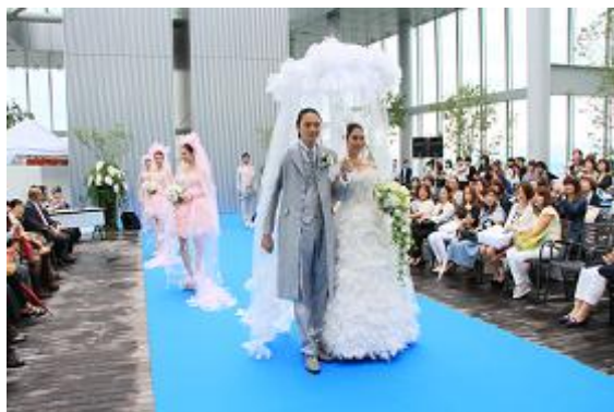
トーク&amp;ファッションショーの様子

また、次に開催予定の「ハルカスウエディングセレモニー」につきましては、既報のとおり9月12日（土）に開催いたしますので、改めてお知らせいたします。詳細は下記をご参照ください。