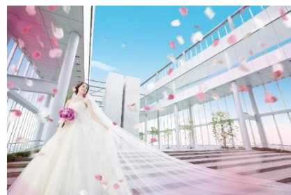
ハルカスウエディングイメージビジュアル