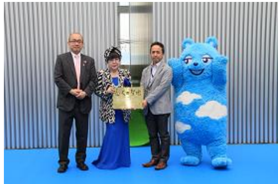
「恋人の聖地」認定書授与